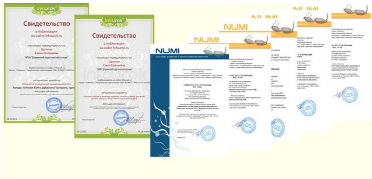
Рис. 2 Сертификаты и свидетельства публикаций студентов групп специальности «Дошкольное воспитание»

2 этап. Основная задача – выявить способных студентов, готовых на творческую работу по созданию совместных интернет- проектов, и готовых своим примером показать успешность таких проектов. На этом этапе нами были организованы в рамках учебных занятий различные конкурсы: «Лучший конспект по речевому развитию детей раннего возраста», «Лучшая презентация детской книги», «Лучшая мультимедийная викторина по произведениям детских писателей». Победители групповых конкурсов публиковали свои работы в различных интернет – изданиях и стали участниками совместных с преподавателем интернет-проектов. (Рис. № 2)