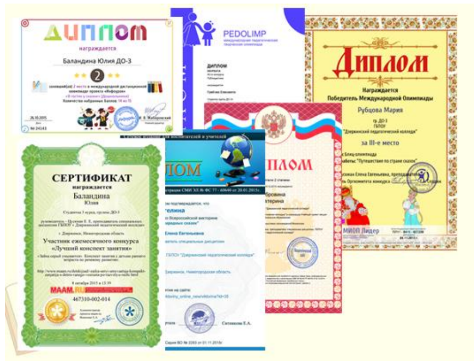
Рис. 3 Дипломы и благодарности участия студентов в олимпиадах и конкурсах.

В результате такой работы наметилась положительная тенденция. Студенты стали раскрывать творческий потенциал своей личности и у них возникло желание поделиться скрытыми талантами. Одна из студенток выразила желание опубликовать авторское стихотворение «Мой город родной!», в чем ей была оказана методическая помощь: оформление работы, подготовка к публикации, сама публикация на портале «Таланты России». Итог - 2 место во Всероссийском конкурсе молодых поэтов «Таланты России». (Рис. 4).