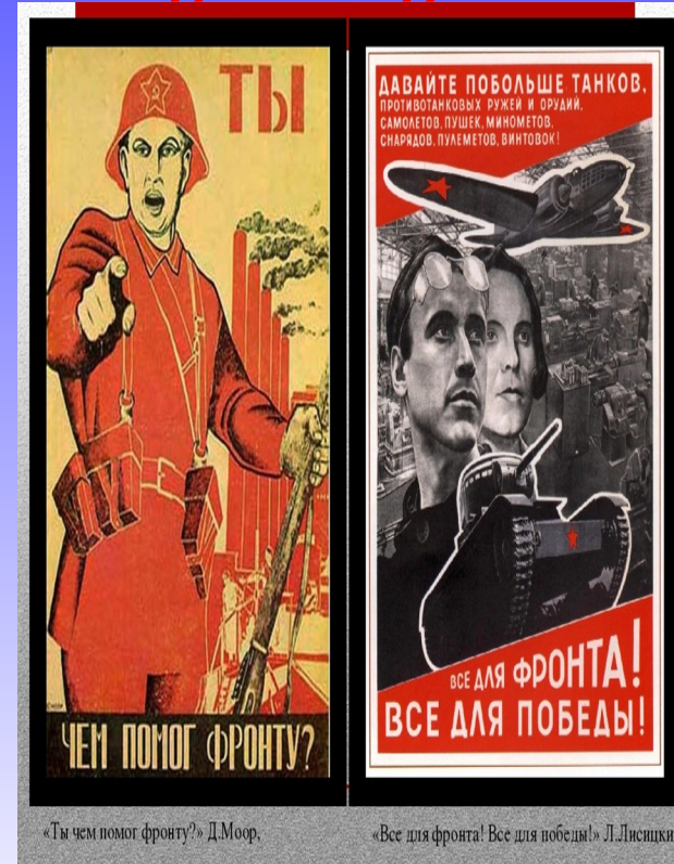
«Ты чем помог фронту?» Д.Моор.